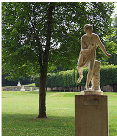
Le domaine de Marly

Le département compte 13% des monuments historiques de la Région . Quatre arrêtés de protection ont été pris en 2009 concernant le domaine de Marly à Marly-le-Roi , le château de Brouéssy à Magny-les-Hameaux et la maison Bechmann à Jouy-en-Josas .