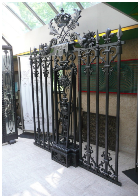
La préfète a rendu hommage à l'exceptionnel savoir-faire de la Fondation Coubertin à Saint-Rémy-lès-Chevreuse le 21 mai 2010

En 2009, le service départemental de l'architecture et du patrimoine (SDAP) , au titre de ses missions de promotion d'une architecture et d'un urbanisme de qualité et de la conservation du patrimoine, a accompagné la mise en place d'une réforme importante de la réglementation des monuments historiques .