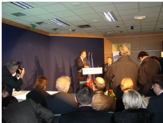
Remise du rapport sur la modernisation de l'école par le numérique de Jean-Michel Fourgous à Luc Chatel, Ministre de l'Education Nationale le 15 février 2010

Une seconde dotation pour 24 communes supplémentaires a été débloquée début 2010.