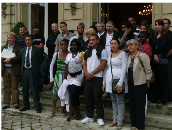
La préfète, accompagnée de Catherine Hénuin, sous-préfète, chargée de mission pour la politique de la ville, a reçu les élèves de différentes écoles de la deuxième chance du département, le 7 juillet 2009

Enfin, 26 places d'internat d'excellence ont été labellisées en 2009 et réservées pour des élèves en éducation prioritaire dans 4 établissements scolaires des Yvelines.