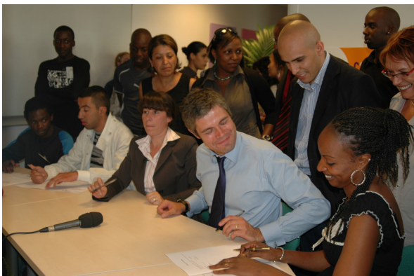
Les premiers contrats d'autonomie ont été signés à Mantes-la-Jolie le 10 juillet 2008 en présence de Fadela Amara, Secrétaire d'Etat chargée de la politique de la ville et de Laurent Wauquiez, Secrétaire d'Etat à l'emploi.

Le contrat s'adresse à des jeunes de 16 à 25 ans issus des ZUS, faiblement qualifiés . Cette offre d'accompagnement personnalisé et renforcé d'une durée de 6 mois vise l'accès à un emploi, une formation qualifiante, voire la création d'entreprise.