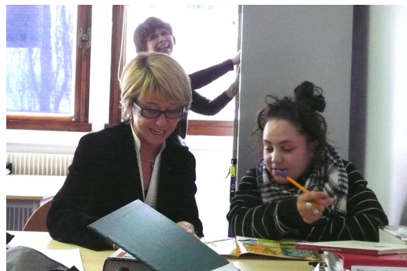
Déplacement de la préfète le 6 février 2009 à l'école de la deuxième chance de Trappes